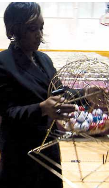
El sorteo en Waiting for "Superman".