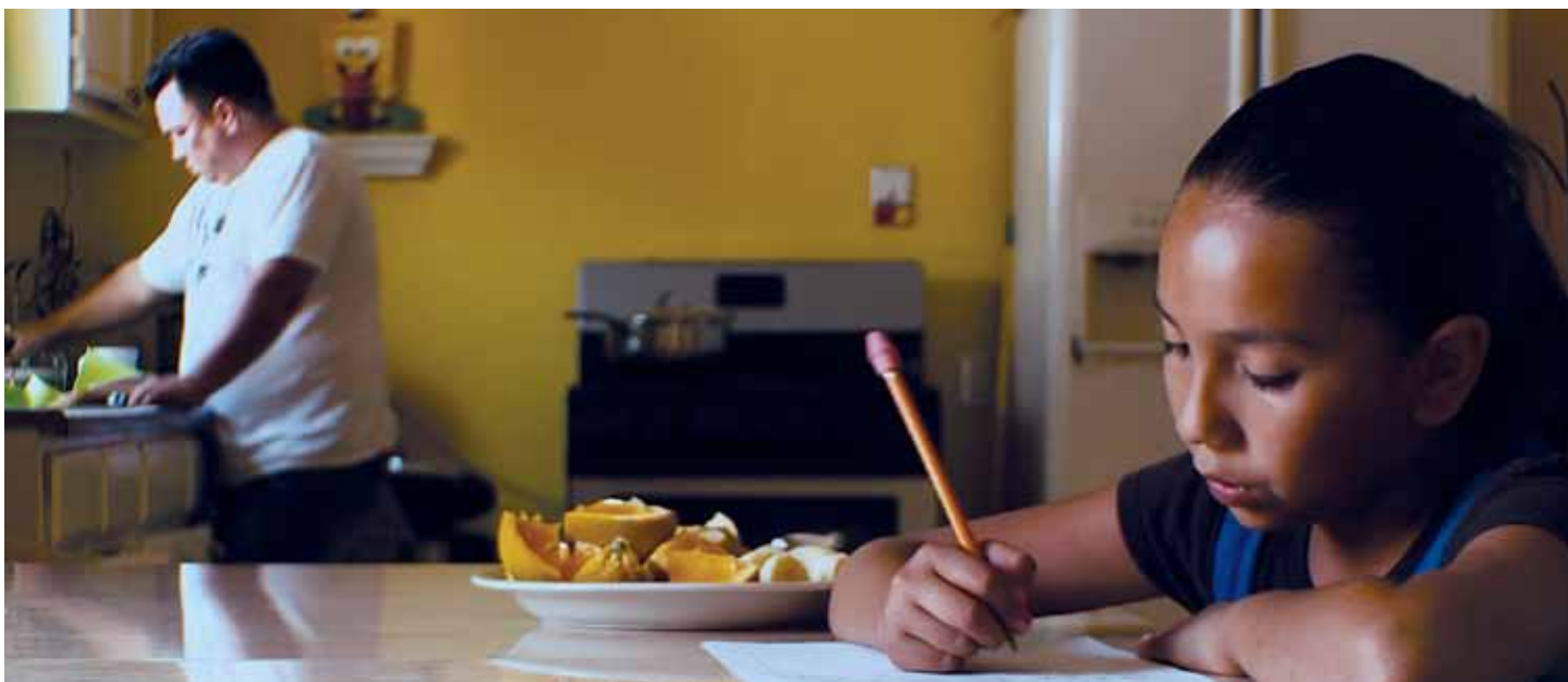
Daisy (derecha) y el padre.