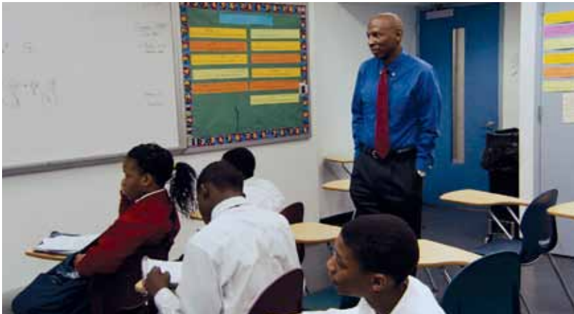
Geoffrey Canada (de pie) con alumnos.

Programas integrales para alumnos de grados intermedios y escuelas secundarias que combinan la investigación, un plan de estudios estándar y un amplio desarrollo profesional con el fin de crear entornos de aprendizaje positivos y que supongan un desafío. Ambos programas están a cargo del Centro para la Organización Social de Escuelas (Center for Social Organization of Schools) de la Universidad Johns Hopkins.