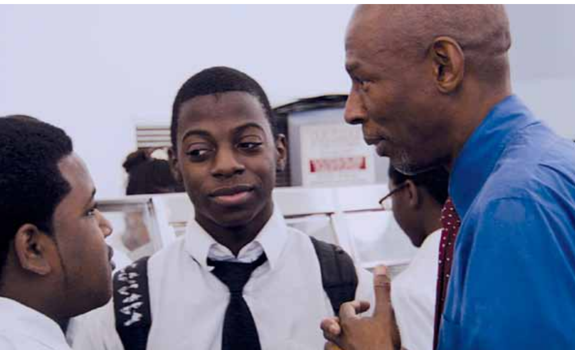
Geoffrey Canada (derecha) con los alumnos (izquierda).

Participación de los padres: Décadas de investigación señalan los beneficios que genera la participación de los padres y los tutores en la educación de los hijos. Algunos de los beneficios incluyen mayor asistencia a clase, logros académicos, motivación, aumento de la autoestima y mejor comportamiento en la escuela.